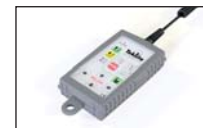
Commande à distance par câble-LVG

1,5 m câble spiralé + 10 m câble linéaire