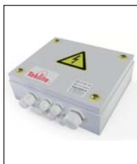
Unité de jonction/contrôle "GME-Motion"

Poids: 14,3 kg - Surface du vent: 0,05 m 2 - Ø30 axe