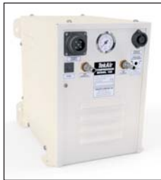
Compresseur "TekAir" modèle 185

Compresseur avec piston sans huile, complètement sans entretien.