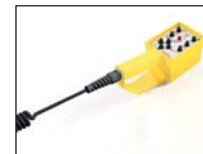
Commande à distance par câble-YH