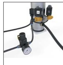
Kit vanne de pression d'air (fixation à la base du mât)

Kit composé d'une valve ouverte et d'une valve fermée, un manomètre avec un régulateur de pression d'air & pressostat.