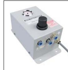
Régulateur de pression d'air (fixation au véhicule)

Unité combinée comprenant une valve ouverte et une valve fermée, un manomètre avec régulateur de pression d'air & pressostat.