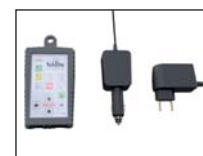
Kit commande RF à distance

Option: extensible jusqu'à 6 boutons (projecteurs)