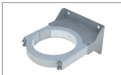
Support de fixation mural