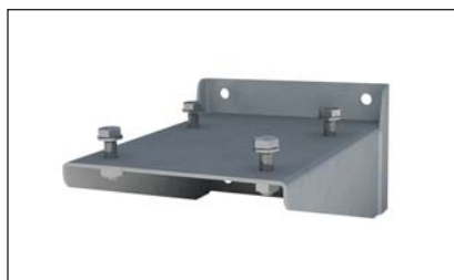
Support de fixation inférieure