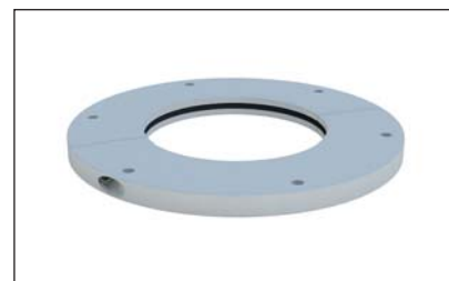
Traversée de toit