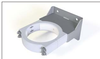
Support de fixation mural