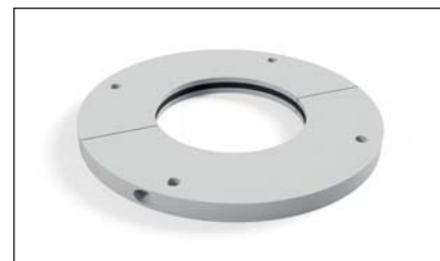
Traversée de toit