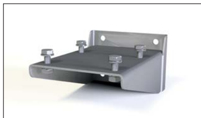
Support de fixation inférieure