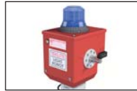
Gyrophare LED "Teklite" Réf. 52260

Couleurs disponibles: rouge, bleu, ambre et vert