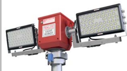
Modèle 2 x 100 watts LED (51788)