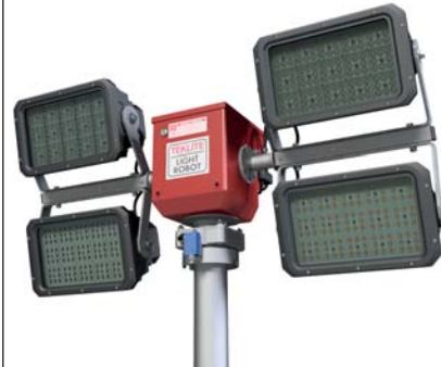
Modèle 4 x 300 watts LED (52996)