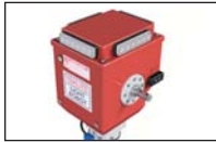
Gyrophare LED "Quadriflash" Réf. 52262

Couleurs disponibles: rouge, bleu, ambre et vert