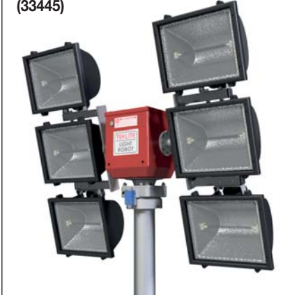
Modèle 6 x 1000 watts halogène* (33445)