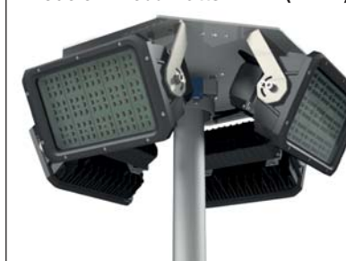
Modèle 4 x 300 watts LED* (52989)