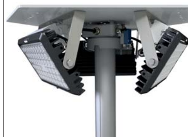
Modèle 3 x 100 watts LED* (52659-4)