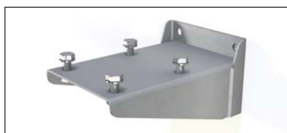
Support de fixation inférieure