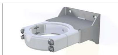
Support de fixation mural