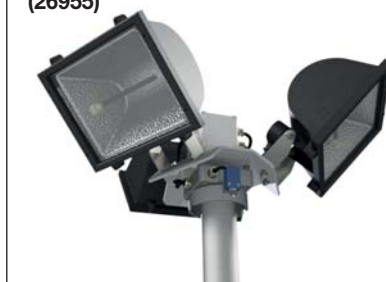
Modèle 3 x 1000 watts halogène** (26955)