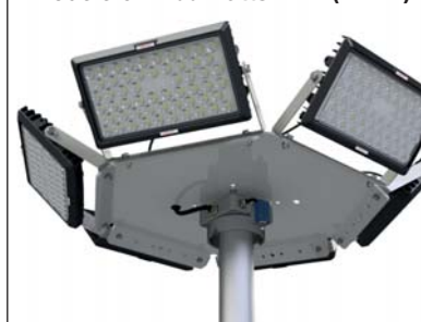
Modèle 6 x 100 watts LED (52652)