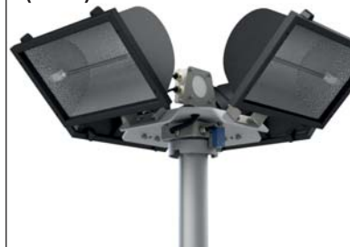
Modèle 4 x 1500 watts halogène** (27145)