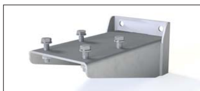
Support de fixation inférieur Réf. 50553