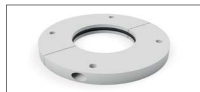
Traversée de toit Réf. 27623-SG