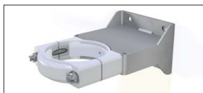
Support de fixation supérieur Réf. 50327-SG