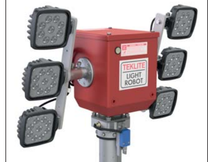
Modèle 6 x 45 watts LED (52706)

D'autres unités d'éclairage disponibles sur demande.