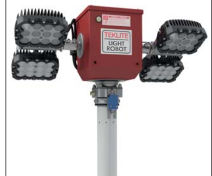
Modèle 4 x 100 watts LED (52672)