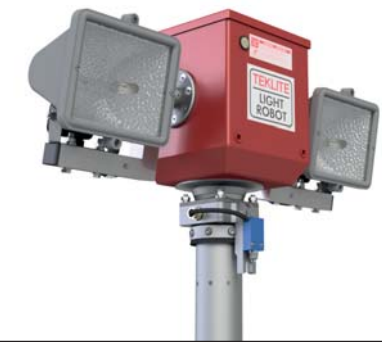
Modèle 2 x 500 watts halogène* (25279)