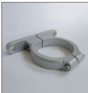
Support de fixation murale