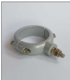
Anneau de fixation