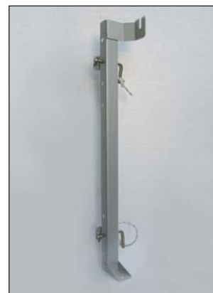
Support de fixation pour véhicule