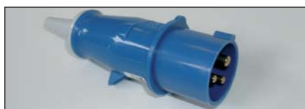
Typ CEE17 Farbe : Blau