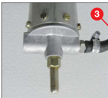
Zapfen am Mastfuss für schnelle und einfache Befestigung am Dreibeinstativ oder Fahrzeug-Anbausatz