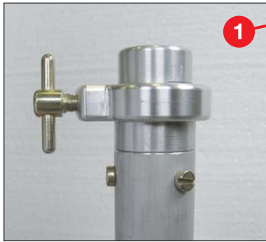
24 mm Klemmsystem