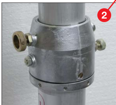
verstellbarer Drehkragen, standard farblos anodisierte, nahtlos gezogene, Aluminiumrohre mit \text{\O} 2\frac{1}{2} " (63,5 mm) Basisrohr