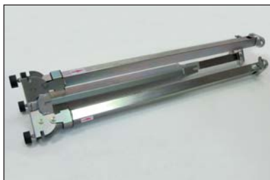
Ausführung Dreibeinastativ : Edelstahl

Dieses sehr stabile Dreibeinastativ lässt sich vertikal zusammen klappen und kann leicht getragen und verstaut werden. Alle MK VI Dreibeinastative können sowohl vertikal als auch horizontal verstaut werden.