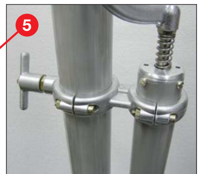
Handpumpe und Knebelschraube für schnelle und einfache Befestigung am Dreibeinstativ oder Fahrzeug-Anbausatz