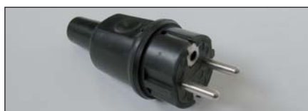
Schuko Vollgummistecker mit zusätzlicher Erdung